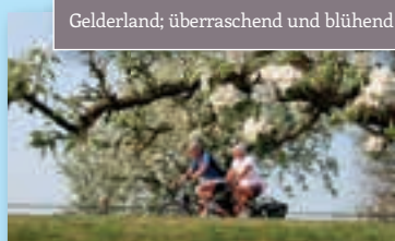
Gelderland; überraschend und blühend!