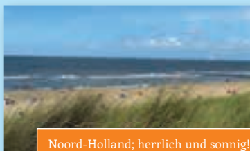
Noord-Holland; herrlich und sonnig!