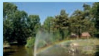
Limburg; unvergesslich und schön!