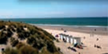
Zeeland; authentisch und gastfreundlich!