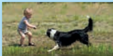
Overijssel; fantastisch und gemütlich!