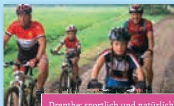
Drenthe; sportlich und natürlich!