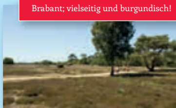
Brabant; vielseitig und burgundisch!